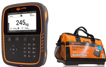
TW-1 Balanza de Pesaje G02601