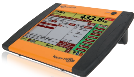
TSi2 Gestor de Ganado G01916