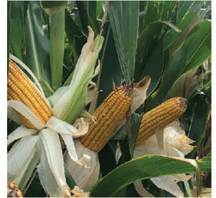
DUO30PW vs IPB2881MGRR2 (6 localidades en Florida, Colonia y Paysandú).

Los resultados en las condiciones de producción de Uruguay, avalan a DUO30PW como la opción de mayor rendimiento en el segmento.